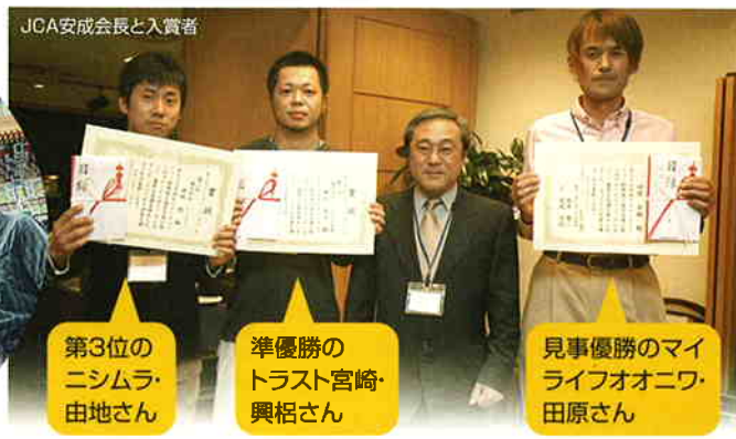
JCA安成会長と入賞者