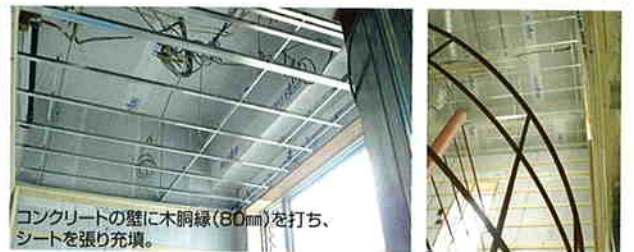
コンクリートの壁に木脚縁(80mm)を打ち、 シートを張り充填。