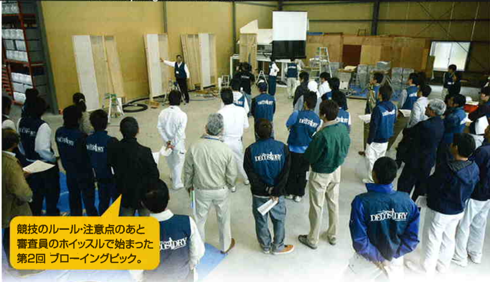
競技のルール・注意点のあと審査員のホイッスルで始まった第2回ブローイングピック。