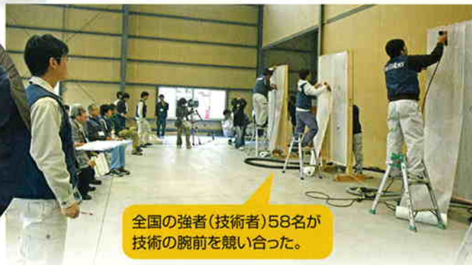
全国の強者(技術者)58名が技術の腕前を競い合った。