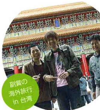
副賞の海外旅行 in 台湾