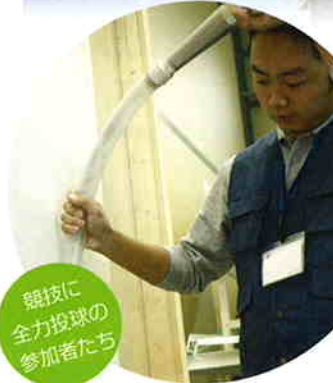
競技に全力投球の参加者たち