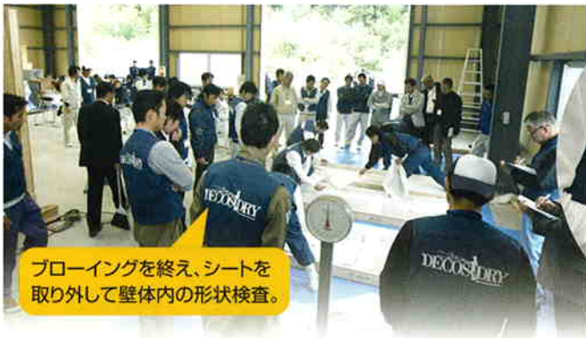
ブローイングを終え、シートを取り外して壁体内の形状検査。