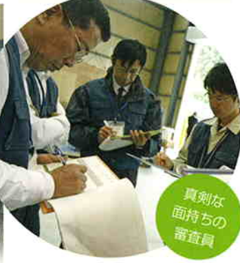
真剣な面持ちの審査員