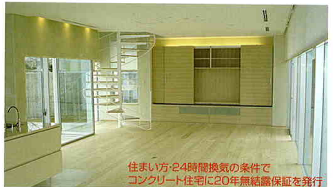
住まい方・24時間換気の条件で コンクリート住宅に20年無結露保証を発行