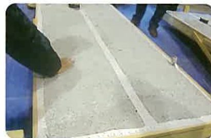
審査員が厳密なチェック!!