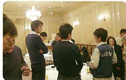
ブローイングピック競技後の懇親会。皆さん、日常業務の情報を交換していました。

あいにくの小雨模様でした。上海は雨や曇りの多い地域のように、上海の地元の人が言うところでは「これくらいの天気は上海では晴れ!」