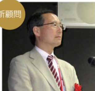
慶應義塾大学 理工学部システムデザイン工学科教授 博士(工学) 伊香賀 俊治氏