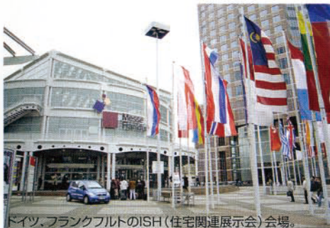
ドイツ、フランクフルトのISH(住宅関連展示会)会場。

ドイツ、フランクフルトでは、東京ドームの20数倍の広さのISH(住宅関連展示会)を2日間にわたって視察し、フライブルグでは「環境の街」と言わしめる、素晴らしい街並みと、FRAUHOFFER(国立建築研究所)を視察しました。研究所員と私たち視察団のフリートークが交わされました。環境先進国のドイツの考え方、取り組む姿勢は、私たち日本の考え方、取り組む姿勢より、一歩進んでいました。