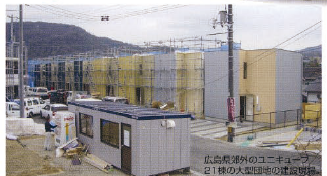
広島県郊外のユニキューブ 21棟の大型団地の建設現場