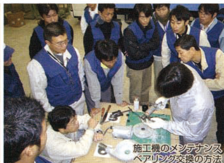
施工機のメンテナンス ベアリング交換の方法