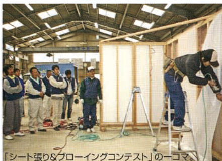
「シート張り&ブローイングコンテスト」の一コマ。