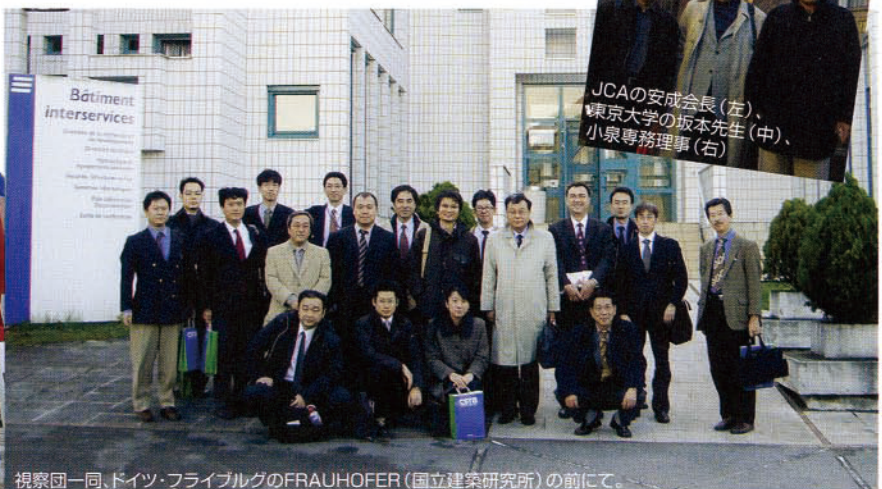
視察団一同、ドイツ・フライブルグのFRAUHOFFER(国立建築研究所)の前にて。