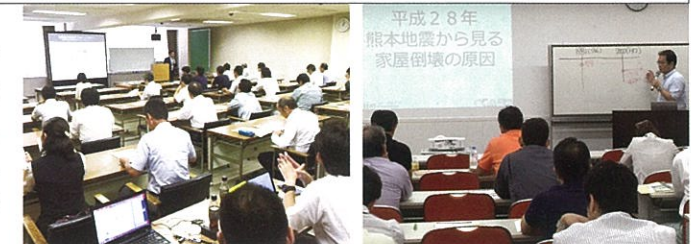
平成28年 熊本地震から見る 家屋倒壊の原因

日本ボレイト(株)、エイム(株)、日本住環境(株)、日本ERI(株)とともに、国交省長期優良住宅化リフォーム推進事業のルールと事例をわかりやすく解説するコラボセミナーを開催しました。ひとつの架空物件を想定し、長期優良住宅化リフォームにおける「特定性能向上工事」の各専門家が、それぞれのノウハウをわかりやすく、かつ、具体的に解説。各社の特長が大いに盛り込まれたセミナー。509名の方にご参加いただきました。